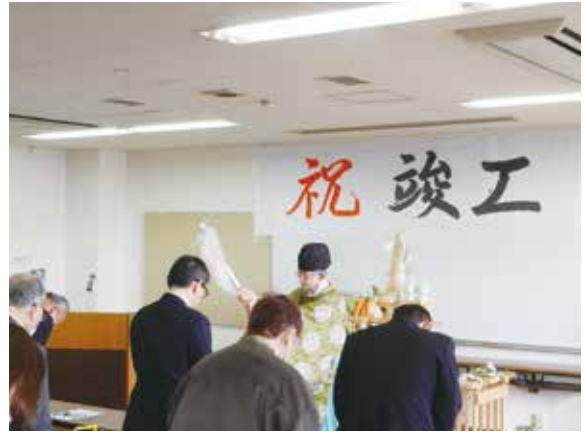
中領八幡宮 宮崎宮司様による神事