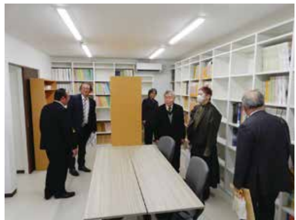
見学会 2F図書コーナー