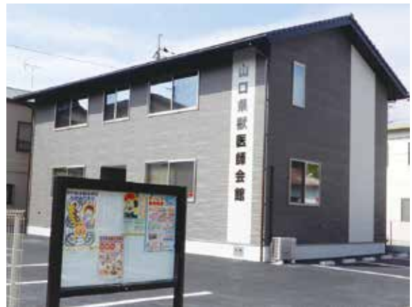
見学会 新会館外観