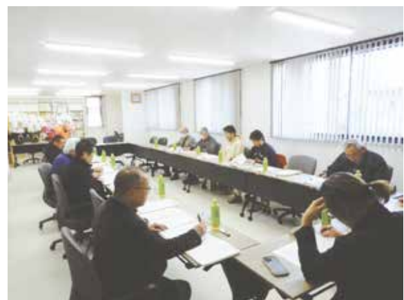
新たな獣医師会館会議室での初めての支部長会議

議題5 では、令和7年度の表彰(日本獣医師会長、中国地区獣医師会連合会長、山口県獣医師会長)候補者の推薦について依頼しました。