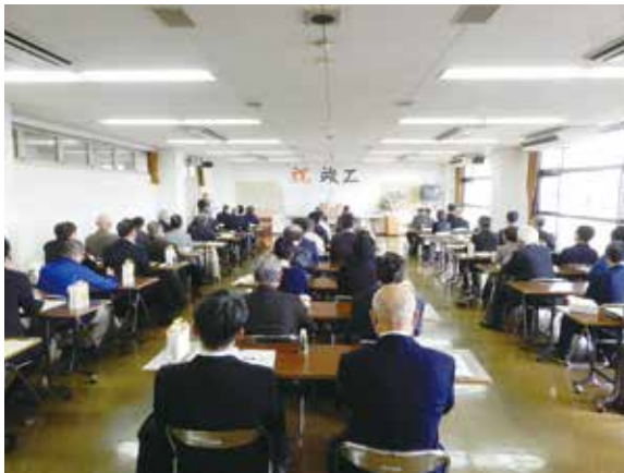
竣工式会場の様子