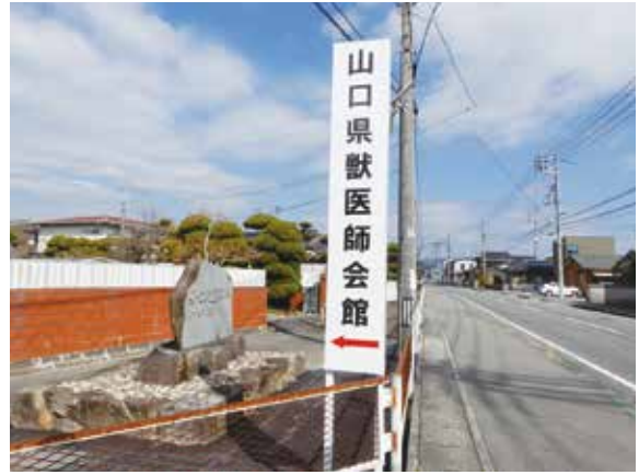
見学会 新しくなった外部案内看板