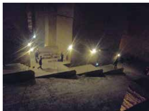
大谷資料館（大谷石地下採掘場跡）